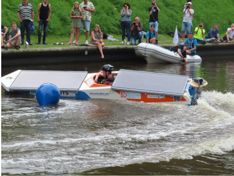
Solarboat Drachtster Lyceum 5x op rij Nederlands Kampioen!