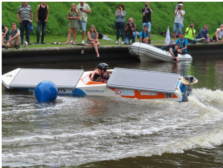
Solarboat Drachtster Lyceum 4x op rij Nederlands Kampioen!